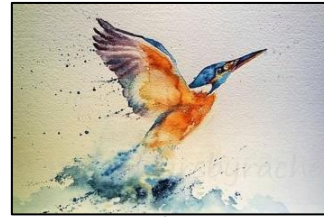
Kingfisher Un martin-pêcheur Une aquarelle de Rachel Toll