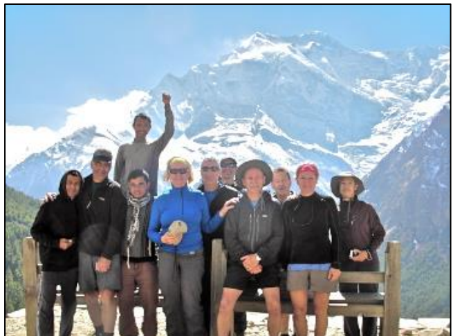
Photo du groupe prise à CHYARU dans les Annapurnas à 3 500 mètres d'altitude.